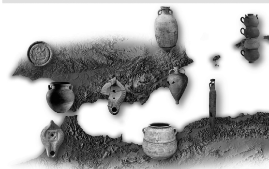
Figura 1. Díptico del Coloquio organizado en la Casa de Velázquez el 14 de marzo de 2025 en el que se presentó el volumen, con la participación de varios de los autores

sintetiza casi un milenio de recepción de productos cerámicos africanos, sobre todo ánforas, planteando a partir del examen minucioso de los registros una revisión de las complejas relaciones establecidas entre Gadir y el ámbito cartaginés. El siguiente bloque de contribuciones da continuidad en buena medida a esta aproximación a la circulación de cerámicas (pero también de otros bienes, personas y a problemáticas históricas más complejas), tratando casos igualmente específicos de ambas orillas de la región. Por una parte, junto a las columnas hercúleas, se examinan y discuten las importaciones de origen cartaginés encontradas en el santuario rupestre de Gorham's Cave (Gutiérrez et alii , pp. 71-84), que constituyen un conjunto diacrónico excepcional entre los lugares de culto occidentales, pero que encuentra ahora un cierto correlato en la secuencia de importaciones de la bahía gaditana. Por otro, en la margen sur del Estrecho de Gibraltar, el trabajo de El Qably y Kbiri Alaoui (pp. 85-98) revisa los registros de un ilustre yacimiento como es el enclave de Emsa, en el entorno de Tetuán, centrandolo el foco sobre la problemática de las cerámicas de uso culinario y destinadas